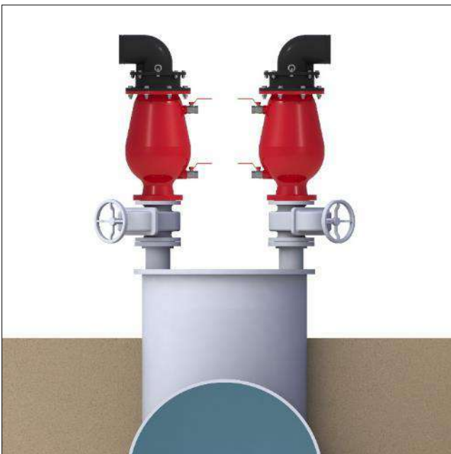
Dos ventosas sobre una trampa de aire con llaves de cierre separadas. Las salidas de las ventosas se dirigen hacia fuera y las llaves de cierre a 45° de las salidas de las ventosas