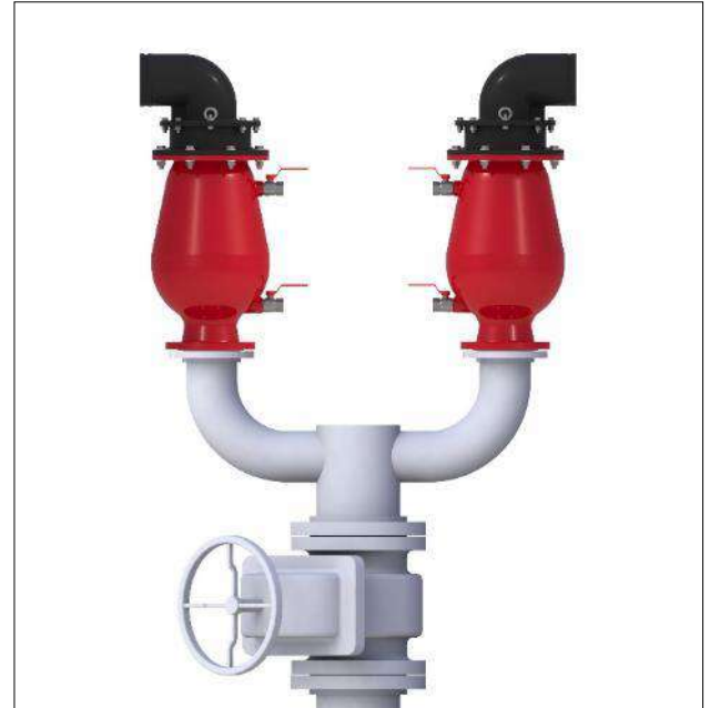
Dos ventosas sobre una llave de cierre compartida. Las salidas de las ventosas se dirigen hacia fuera y la llave de cierre a 45° de las salidas de las ventosas