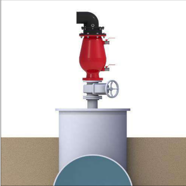
Ventosa única sobre llave de cierre a 45° de la salida de la ventosa